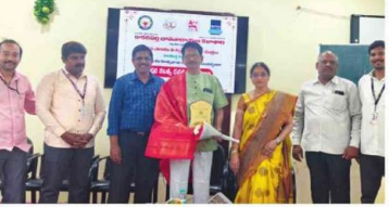
కార్యశాల ముగింపులో పాల్గొన్న కళాశాల యాజమాన్యం, సిబ్బంది